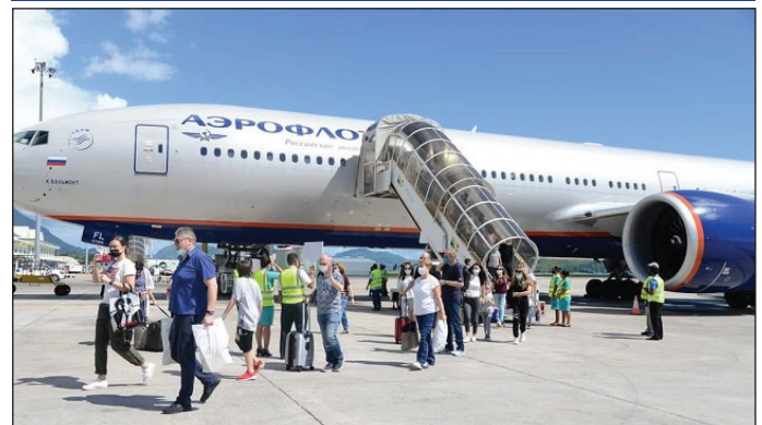
Avyon sorti Larisi i anmenn touris direk Sesel

Z is mazin en ki problem nou ti pou ladan si gouvrenman pa ti'n ouver nou pei avek touris! Zis mazin en ki ti pou'n arive si ti'n napa en program vaksinasyon! Mal-