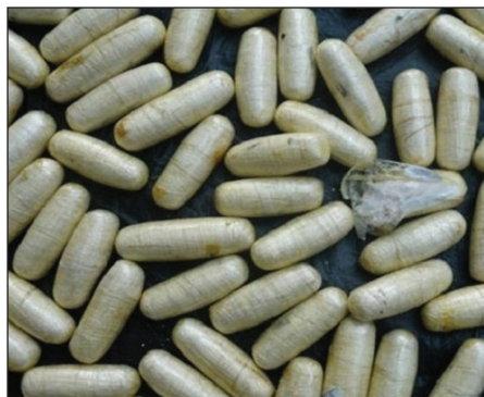
Gouvrenman LDS i reste determinen pour reisir dan sa lalit kont drog e lezot fleo sosyal

Malgre kritik lo ennde lensidan izole, gouvrenman pa pe bes lebra. Okontrer, gouvrenman i reste pli determinen ki zanmen. Gouvrenman i mentenir son promes pour latransparans e i mentenir garanti ki leta pa pou