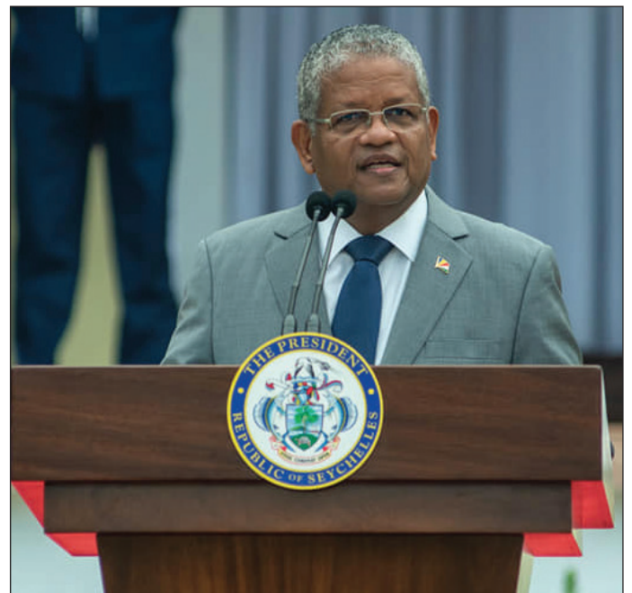
...napa plas pour laenn ek vanzans...

Travayer servis piblik i annan en lobligasyon enplimant polisi gouvrenman dizour dan en fason efikas. Par kont, i annan bokou travayer ( kontinyasyon lo paz 2 )