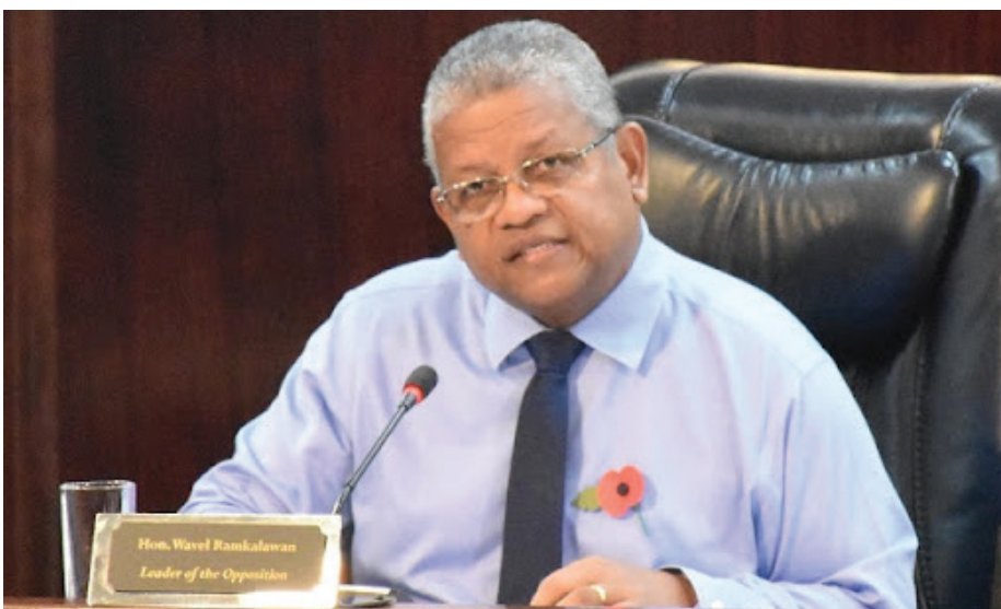
En dirizan lopoziyon ki ti met Sesel avan tou

Prezidan ti donn legzanp an 2008; annou swiv