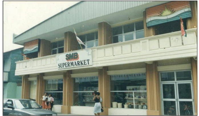
En biznes prive ki ti nasyonelize san rezon

Diferans fondamantal ant US avek LDS i tre senp. US i oule kree dan Sesel en sosyete kot lamazorite sitwayen i viv en lavi depan dan lo leta tandis ki LDS i determinen pour kree en sosyete kot devlopman personnel en sitwayen i depan antyerman lo son zefor. Seselwa in viv anba sa sistenm ki US i krwar ladan pour plis ki 40-an. Ki nou'n eksperyanse anba sa sistenm?