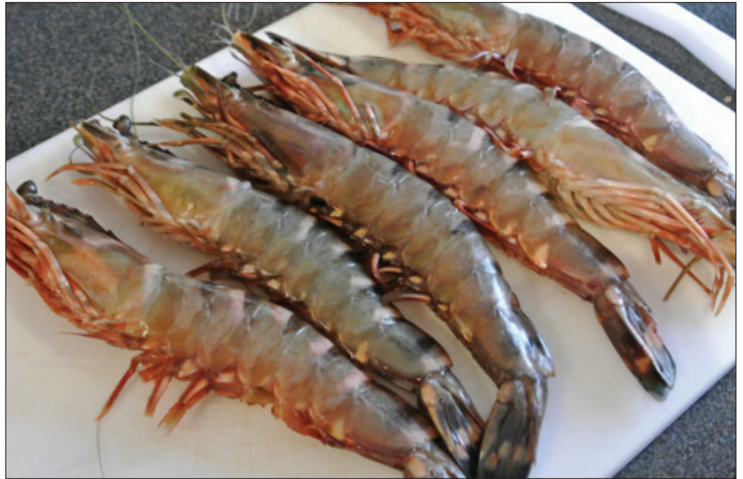
Prodiksyon krevet pou byento en realite lo Coetivy

Gouvèrnman pe osi sivre de pros bann devlopman lo zil Coetivy kot pour annan redevlopman elevaz krevet pou r (kontinyasyon lo paz 2)