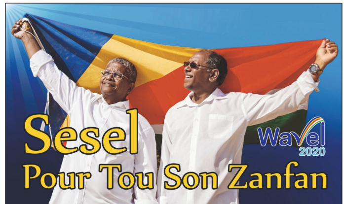
Sesel i osi bezwen tou son zanfan

Dan sa sitiasyon pandemi i annan en pli gran vag lenformasyon ki pe sirkile ki zanmen in deza annan oparavan.