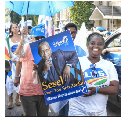
Sipòter LDS pe selebre viktwar absoli dan toulede eleksyon fer an Oktob lannen pase

Nouvo lider US in menase ki Seselwa pou dezorme vwar en nouvo US. Latab in vremen vire. Ozordi zour, LDS i annan en mazoritè absoli dan parlman. Pour apepre 40-an, US ti annan en mazoritè absoli dan parlman kot zot ti amann konstitisyon e sanz lalwa dan zot prop lentere politik. Ozordi, zot konpran byen lenplikasyon en mazoritè absoli e zot trakase ki LDS pou rann zot laparey. Zot in sitan fer dan lepase ki