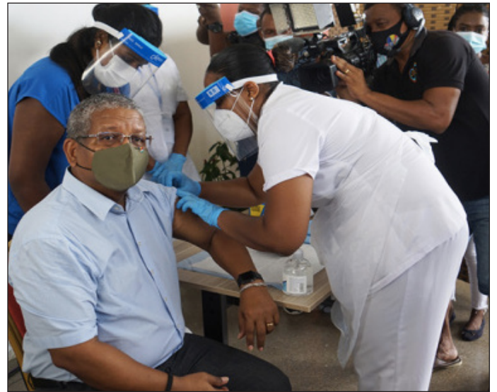
Prezidan Ramkalawan, en dirizan ki pa per pour pran desizyon e diriz Sesel ver en meyer lavenir

Letan zot realize ki Prezidan Ramkalawan pe devlop en relasyon pros e amikal avek bann dirizan Lemira Arab Ini (UAE) kot Sesel pe benefisyé, zot pe kriy lasasen. Sa de vizit ki Prezidan in fer UAE in anmenn bokou pour pei. Sesel in ganny vaksen dan son lalit kont Covid-19, lopital pour bann Digwa, proze Sant Reabilitasyon in ariv