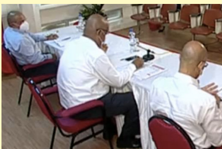
Sa trwa mousketer, i le kre dezord dan Sesel