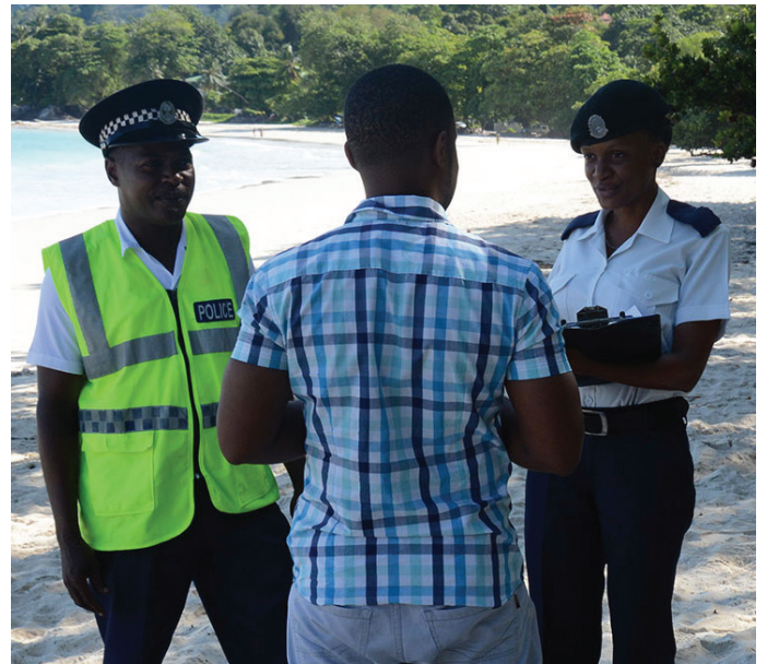
Respe pour lalwa i anmenn lape dan kominote

Sak endividi dan kominote i bezwen fer atansyon ki Sesel pa vin en sosyete ki toleran anver labi drog. Letan sosyete i vin toleran anver konsomasyon e komers drog i fer ki travay bann lazans sekirite i vin bokou pli difisil. Pour Sesel reisi dan sa lalit pou elimine drog lo son teritwar, i bezwen zefor tou son zanf. Malerezman, an rezilta pouvwat ekonomik ki trafik drog i ofer bann kartel, serten sitwayen i les zot ganny enfliyanse par rekonpans finansyel pour siport bann konportman endesan dan kominote e menm debout for kont lotorite leta pour defann bann kartel. Sa i tre serye e bann dimoun ki fer sa i otan koupab ki bann kriminel ki zot pe defann. Dan plizyer kominote, bokou zenn pe les zot ganny