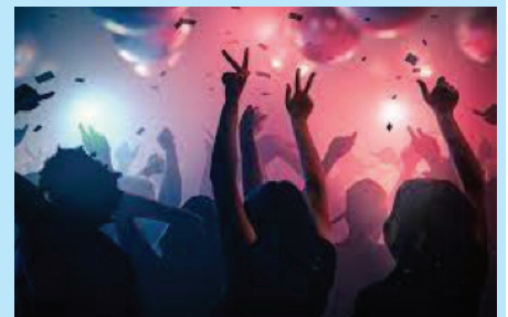
Laliberte mouvman i bezwen ganny konpromi pour konbat transmisyon kovid

pase ti kouronn sa lalit. Avek linogirasyon en nouvo ladministrasyon, Seselwa in santi zot pli lib ki zanmen. Ozordi zour zot santi zot kapab dir e fer sa ki zot oule, ler ki zot oule e mannyer zot oule. Sepandan, laliberte i vin avek responsabilite. Nou bezwen rekonnat sa.